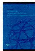
Guia Sobre Legislação Anticorrupção